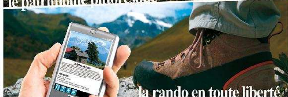
la rando en toute liberté

Alors n'hésitez plus, contacter nous pour en savoir plus et obtenir une documentation. Nous sommes à votre écoute du lundi au vendredi de 9H à 12H et de 14H à 18H au 04 77 91 44 30 ou par courriel m.dezulier@odyssee-software.com