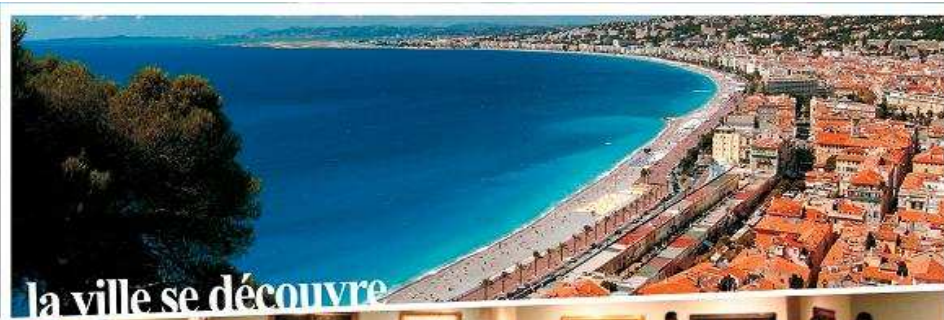
la ville se découvre